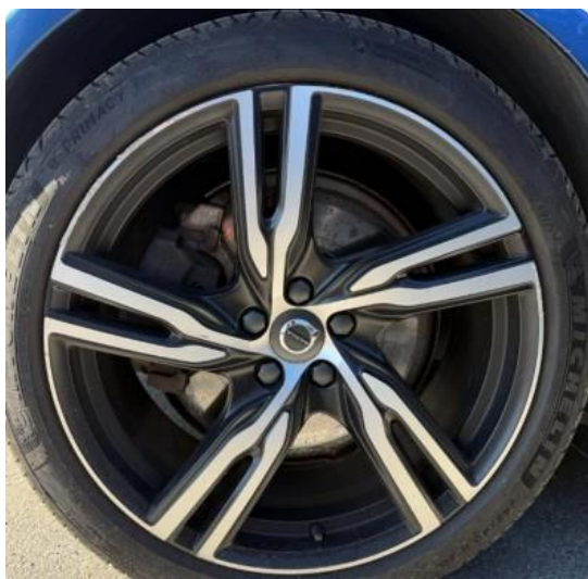
1.3 Noen riper i sommerfelger.