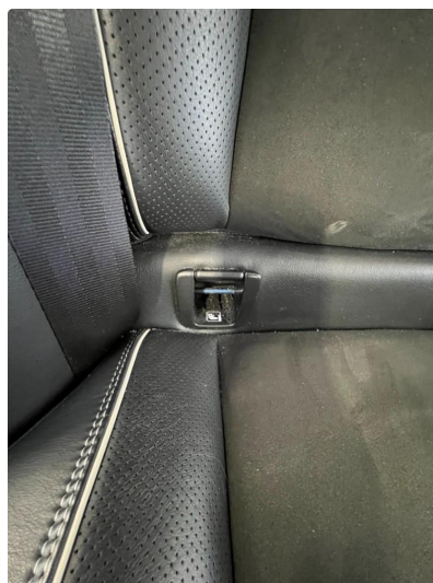
2.1 Mangler deksel over ISOfixfeste høyre bak.