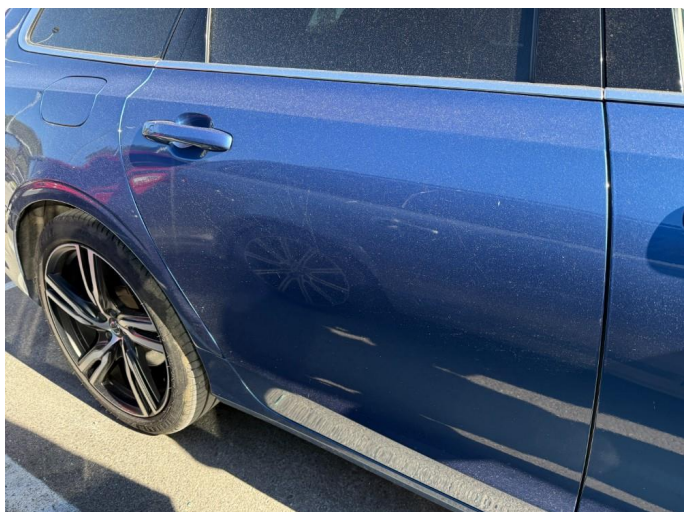
1.1 Normal bruksslitasje iht. alder og kjørelengde.