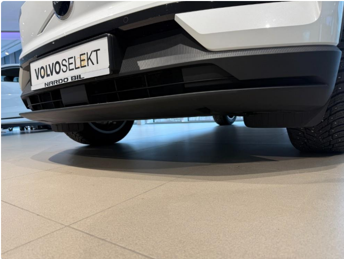
1.1 Sprekk underside støtfanger foran.