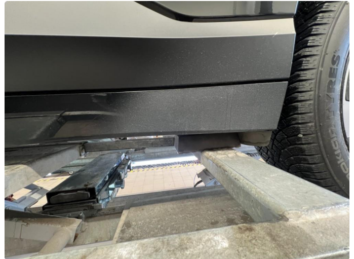
1.1 Matt/slitt lakk kanaler begge sider.