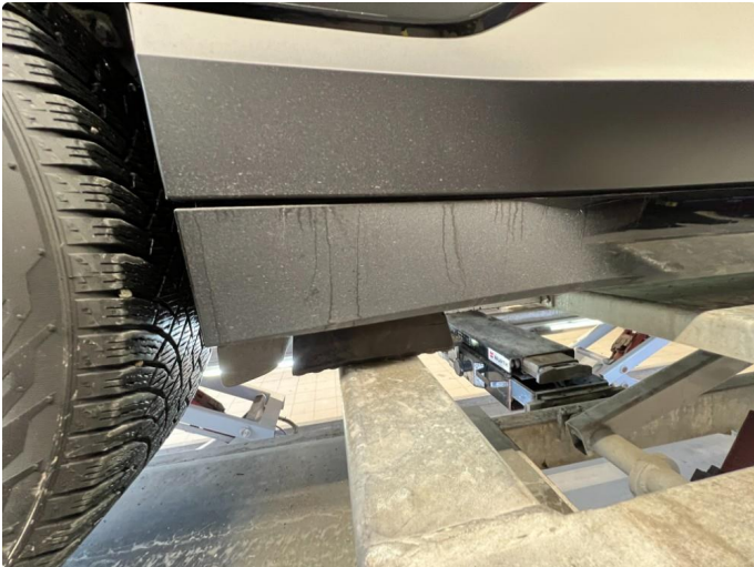
1.1 Matt/slitt lakk kanaler begge sider.