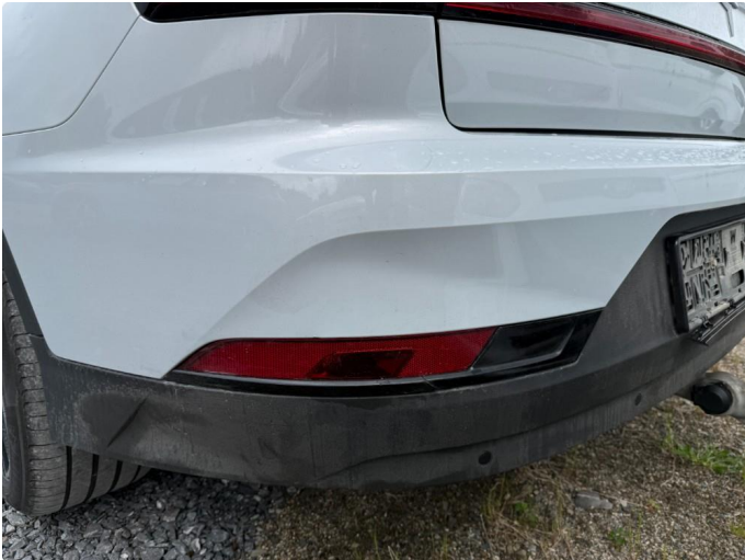
1.1 Sprukket sort detalj under tåkelykt venstre bak.