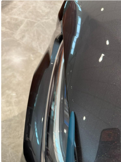
1.1 Små steinsprang på panser