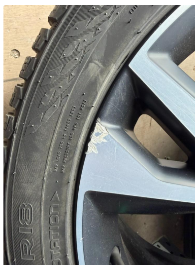
1.4 Litt kantkjørt vinterfelg