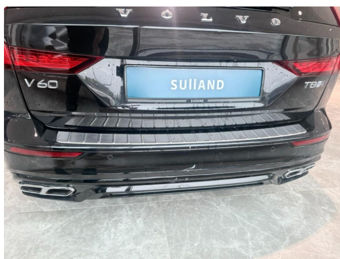
1.6 Litt småskader støtfanger bak