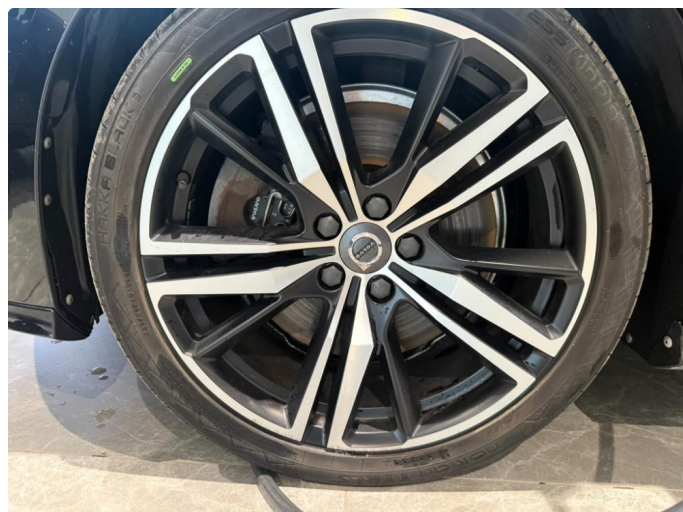
1.2 Litt kantkjørt sommerfelg.