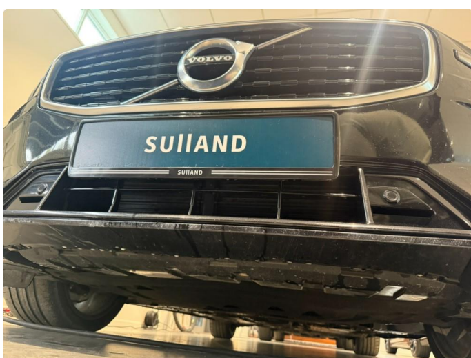
1.5 Noe skrubbeskader frontfanger