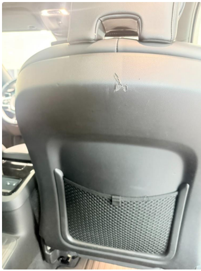
2.1 Liten skade på sete høyre foran.