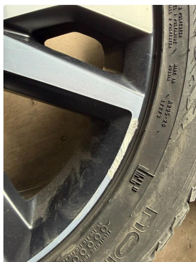
1.3 Litt kantkjørt vinterfelg