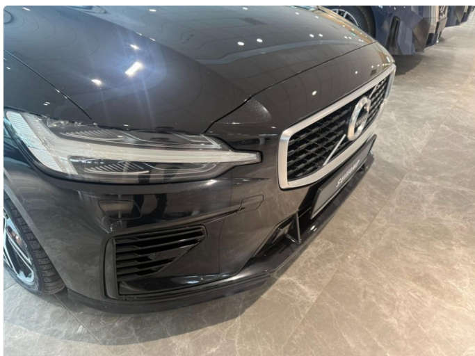
1.1 Noe steinsprang, normalt iht. alder og km.