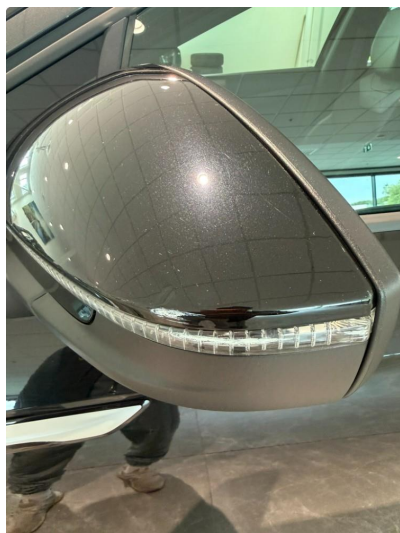
1.1 Liten skrape speil venstre foran.