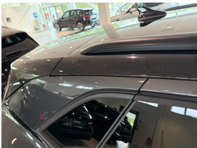
1.3 Noen merker tak høyre bak