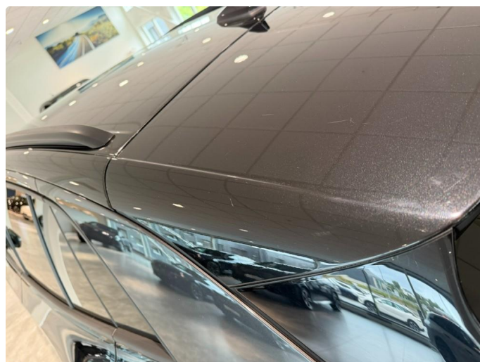
1.4 Små merker venstre bak