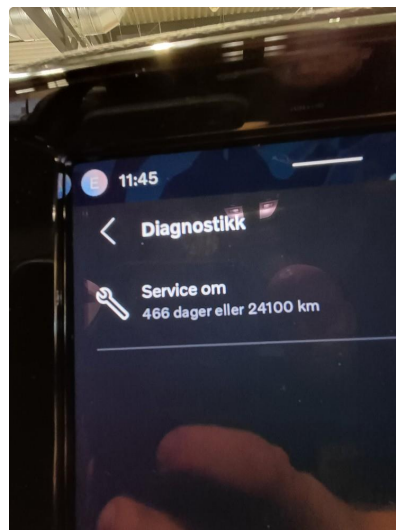
1.1 Dokumentert service, se bilde