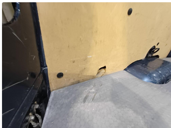
2.1 Deksler skadet/mangler