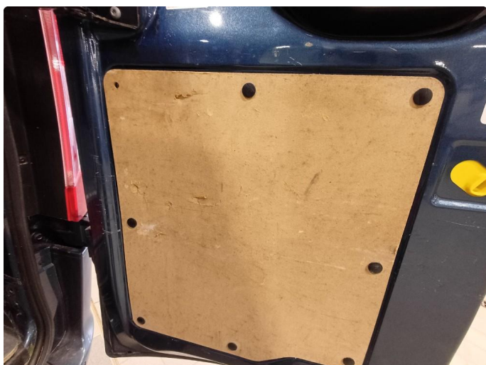
2.1 Deksler skadet/mangler