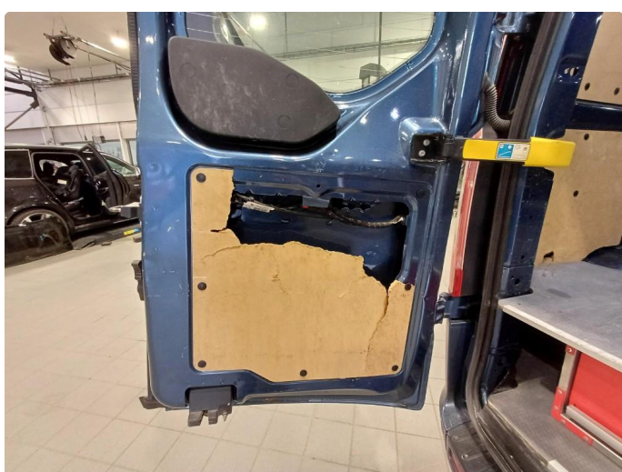
2.1 Deksler skadet/mangler