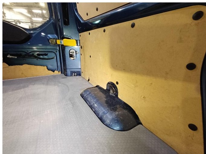
2.1 Deksler skadet/mangler