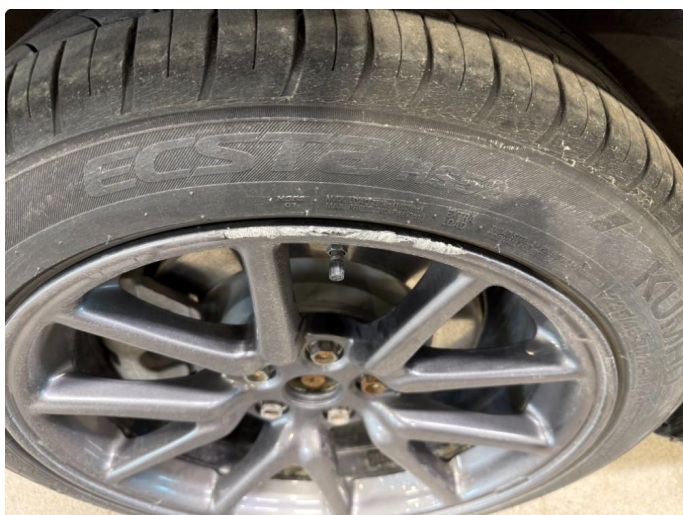
1.1 Ripe (r) gjennom lakk