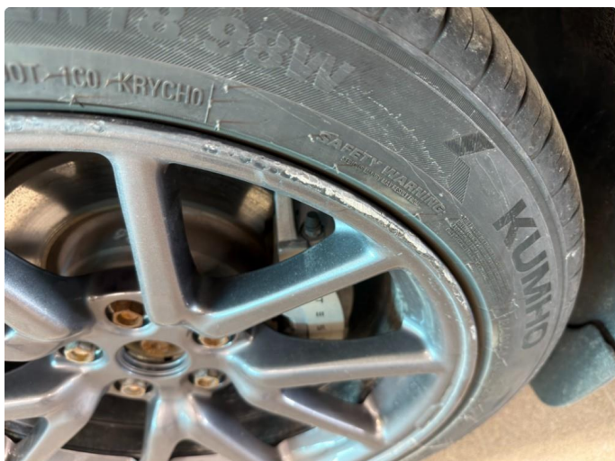
1.1 Ripe (r) gjennom lakk