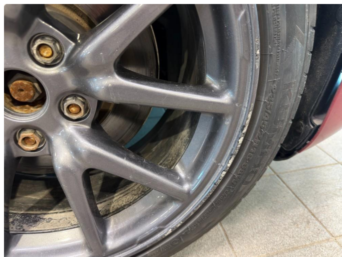
1.1 Ripe (r) gjennom lakk