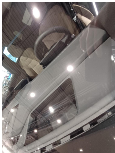
1.1 Stensprut i front og slitasje merke