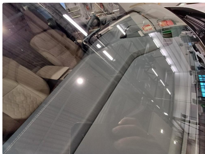
1.1 Stensprut i front og slitasje merke