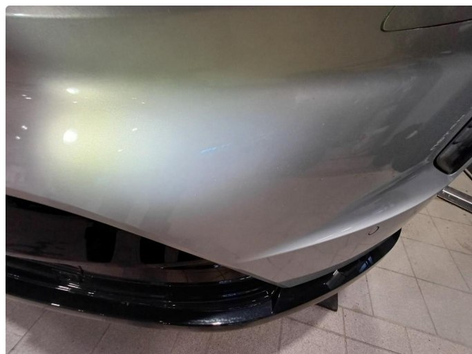
1.1 Stensprut i front og slitasje merke