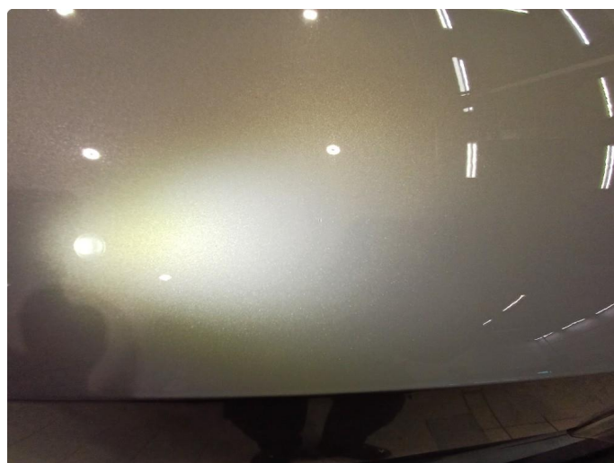
1.1 Stensprut i front og slitasje merke