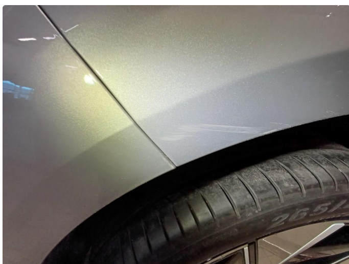
1.1 Stensprut i front og slitasje merke