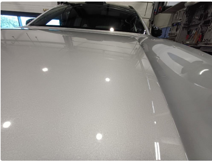
1.1 Stensprut i front og slitasje merke