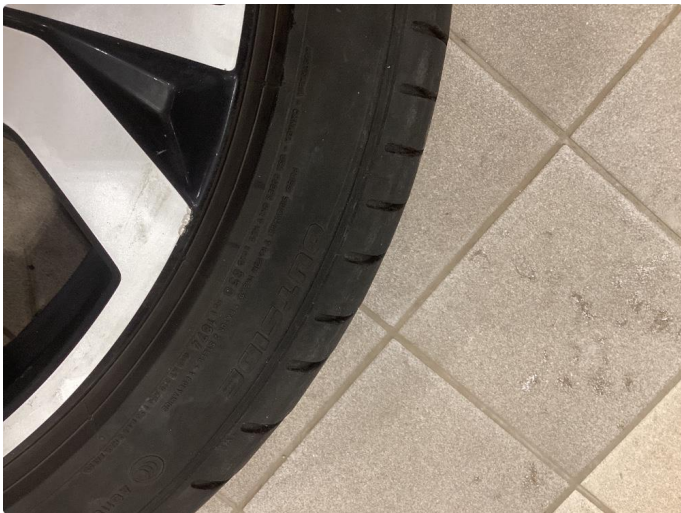
1.1 Lite hakk i kanten av felgen