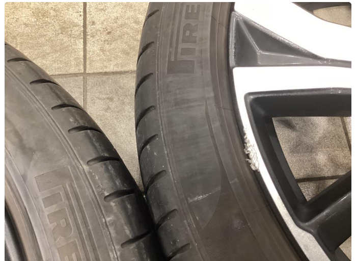
1.3 Lite hakk i kanten av felgen