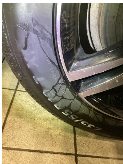
1.4 Lite hakk i kanten av felgen av vinterfelg