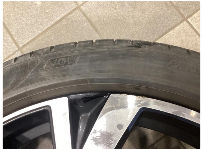
1.2 Lite hakk i kanten av felgen