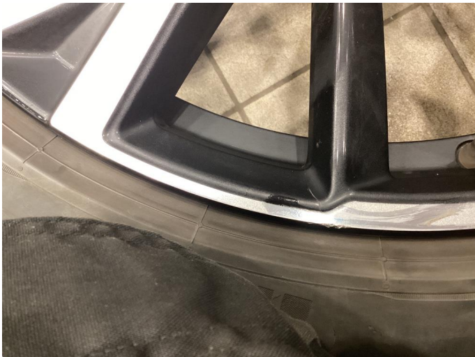
1.2 Lite hakk i kanten av felgen