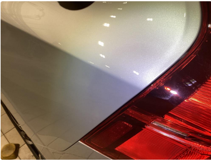
2.1 Krakelering i plast