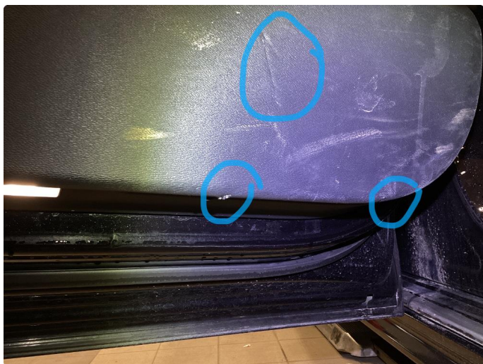
4.2 Litt slitasje på dørtrekk