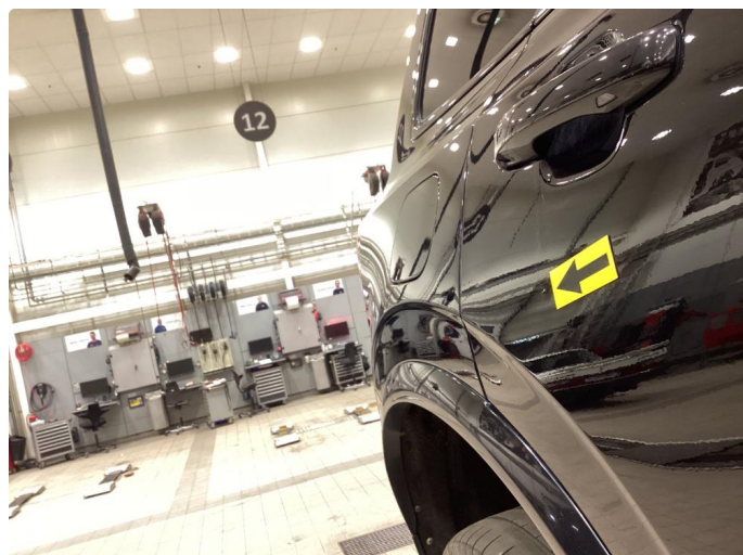
1.2 Rettet m/lakkeringsfri bulkfiks