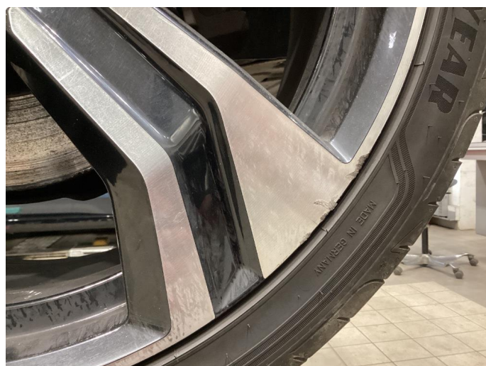
1.6 Skrap i felg