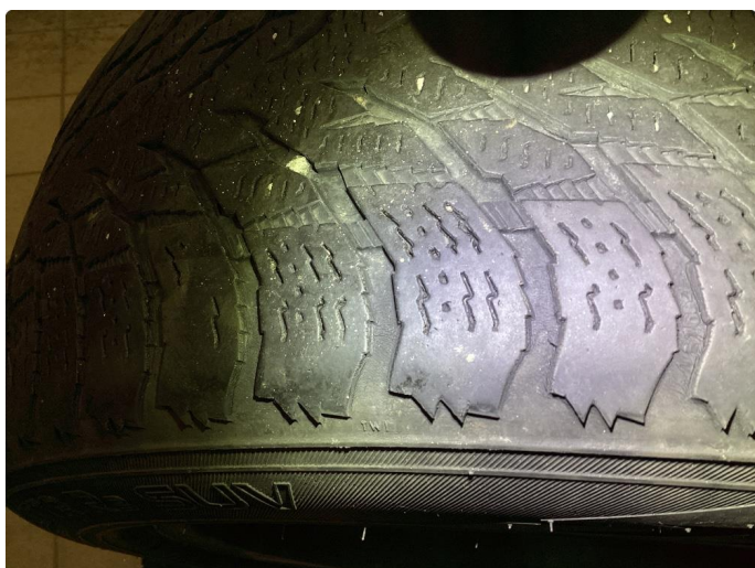
1.3 Monteres nye vinterdekk