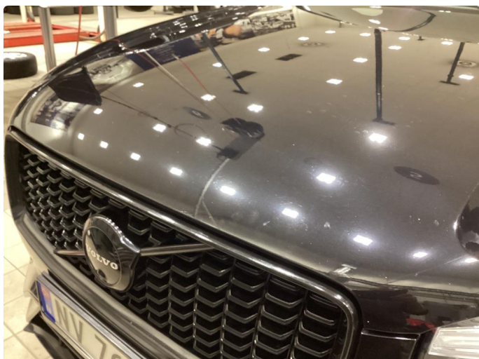
1.1 No steinsprut - normal slitasje