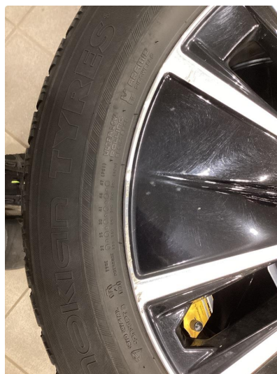
1.4 Skrap i kanten av vinterfelg