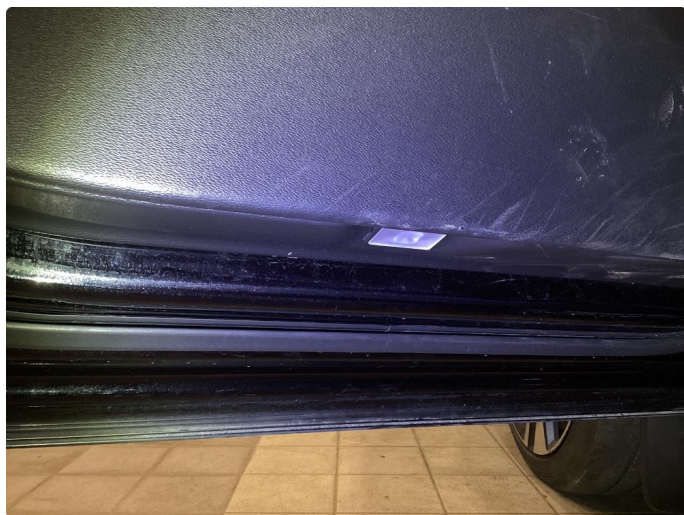
4.3 Litt slitasje på dørtrekk