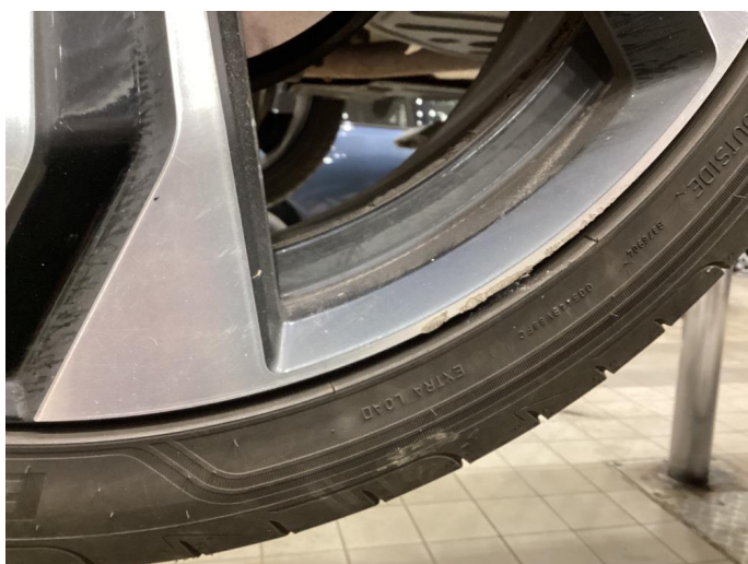
1.5 Skrap i felg