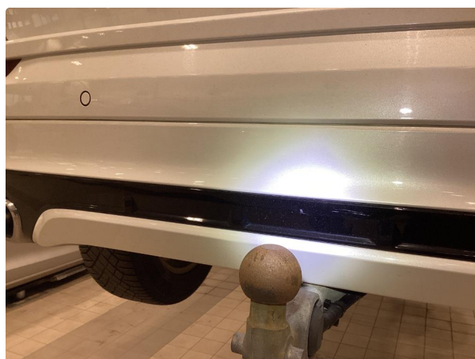
1.4 Små riper bak ved støtfanger