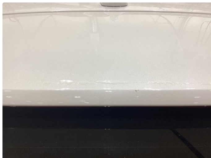
1.2 Ripe/lite hakk