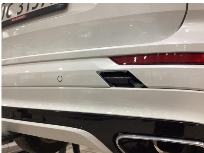
1.3 Mangler tauekrok - Montert