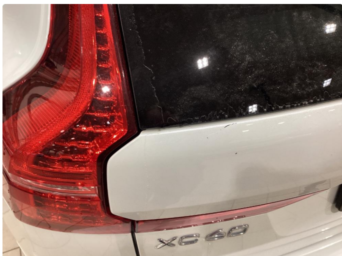
1.1 Ripe/lite hakk