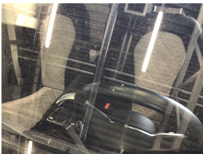
1.5 Steinsprut med sprekk i synsfelt