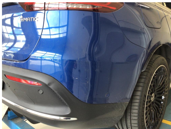
1.4 Ripe(r) ned til grunning