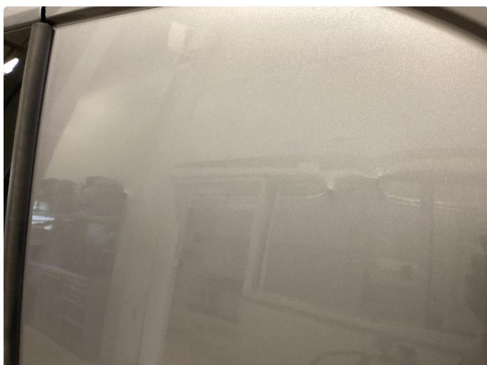
1.2 Bulk utover