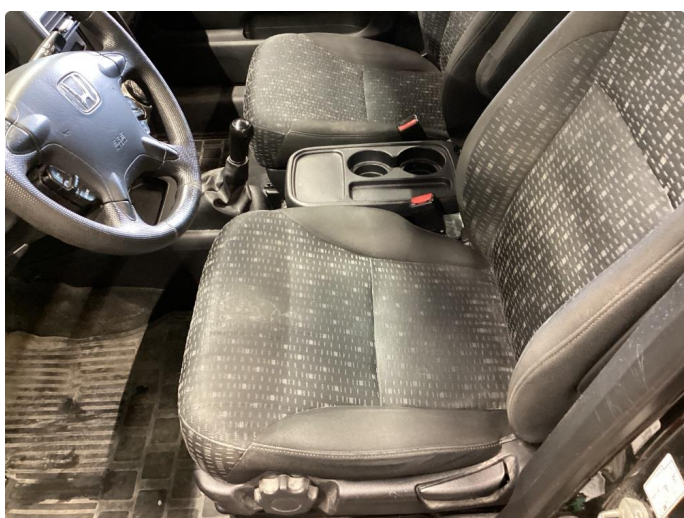
6.2 Dårlig innfestning