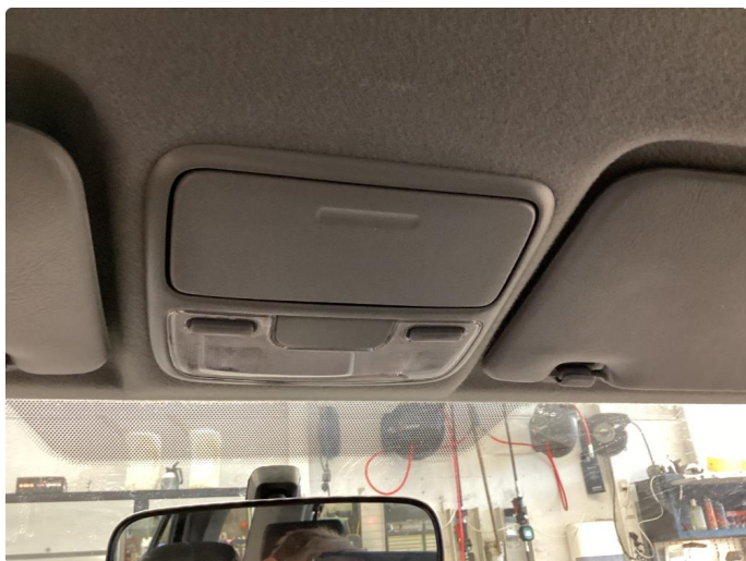
6.1 Øvrige feil