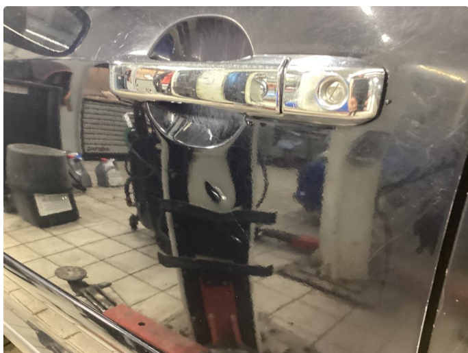
2.6 Bulk med lakkskade