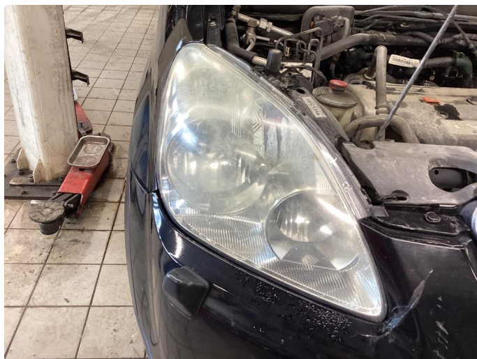
3.1 Matte glass