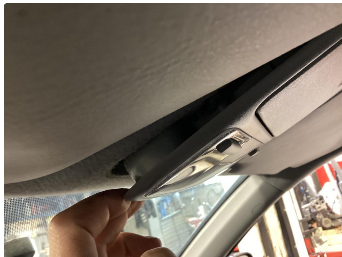
6.1 Øvrige feil