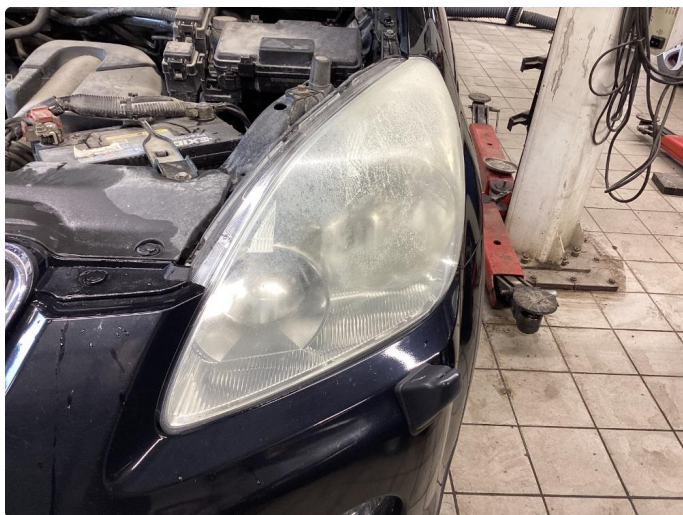
3.1 Matte glass