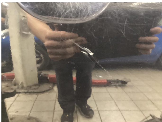
2.6 Bulk med lakkskade