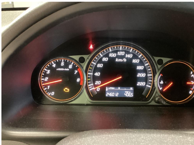
1.1 Varsellampe lyser