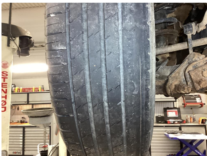
2.9 Skjev slitasje på sommerdekk