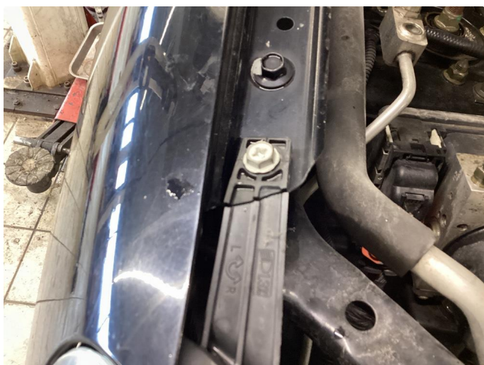
3.2 Øvrige feil