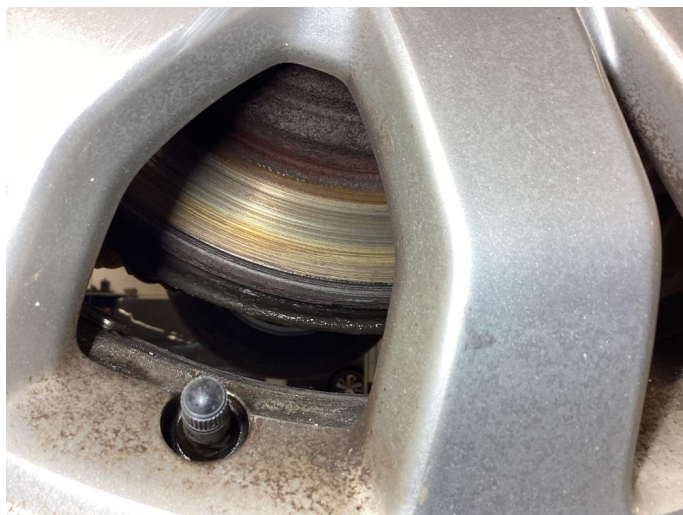
5.2 Slitte/stor slitekant