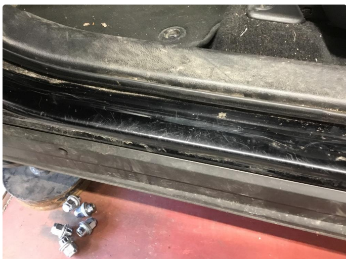
1.3 Slitt innsteg