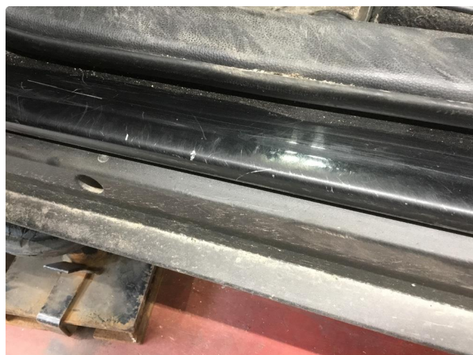
1.4 Slitt innsteg