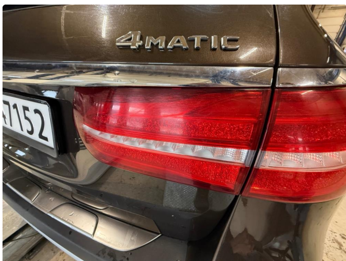
2.1 Lykteglass - Krakelert - Kun kosmetisk (ikke sprukket).