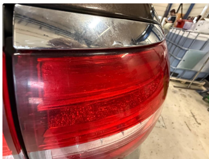
2.1 Lykteglass - Krakelert - Kun kosmetisk (ikke sprukket).