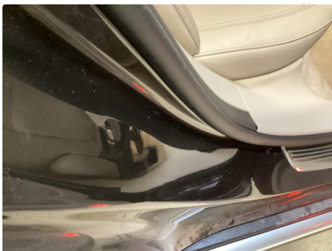
1.6 Bulk etter sikkerhetsbelte