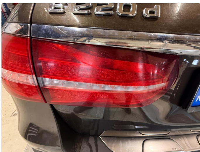
2.1 Lykteglass - Krakelert - Kun kosmetisk (ikke sprukket).