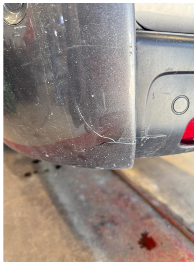
1.5 Sprekk(er) i plast