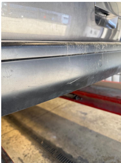
1.5 Sprekk(er) i plast