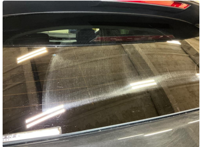
1.1 Slitt bakvindu