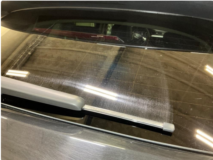
1.1 Slitt bakvindu