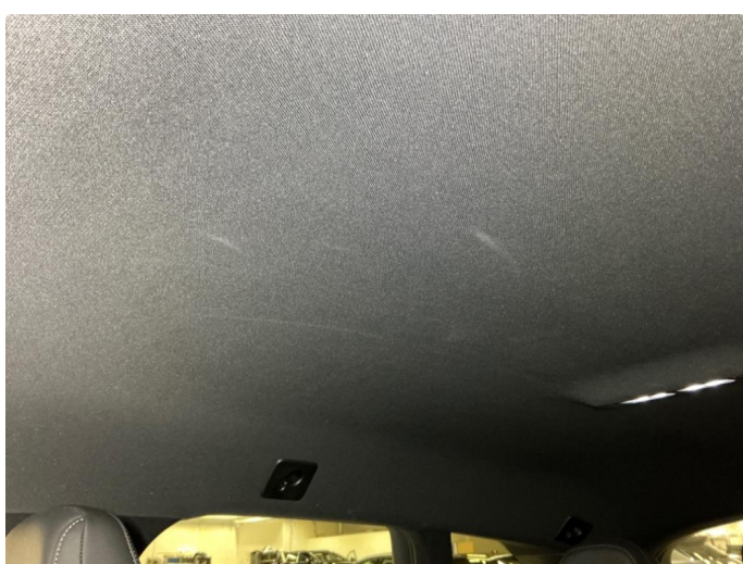
3.1 Noen flekker i taktrekk