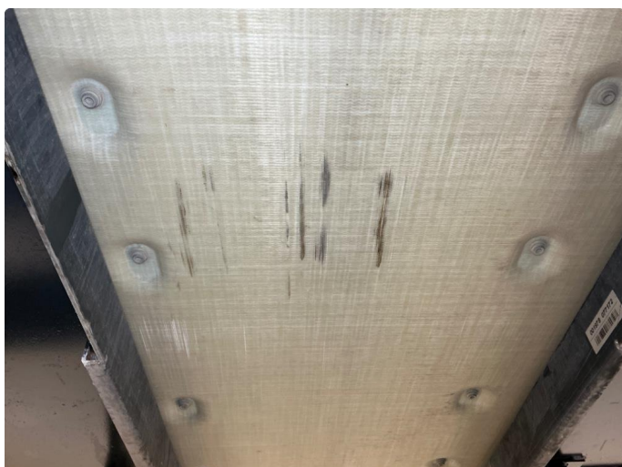
2.1 Riper/skraper i plate under batteri.