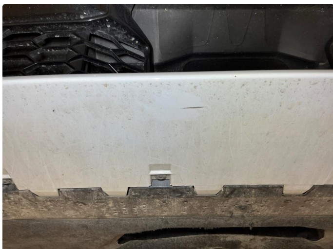
1.1 Foran-skrubbskader underkant