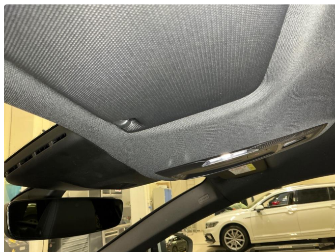
3.1 Noen flekker i taktrekk