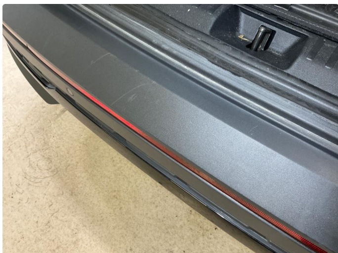
1.1 Riper-Innlasting bakfanger ulakkert plast - mekanisk slitasje