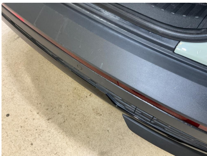
1.1 Riper-Innlasting bakfanger ulakkert plast - mekanisk slitasje