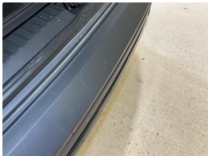
1.1 Riper-Innlasting bakfanger ulakkert plast - mekanisk slitasje