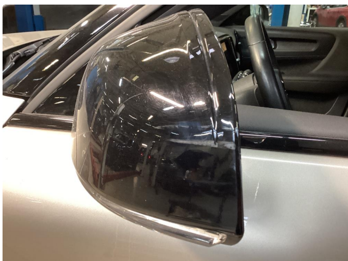
1.3 Speilhus riper