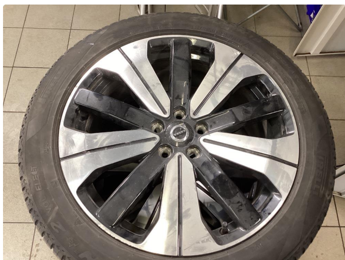
1.5 Kantkjørt felg