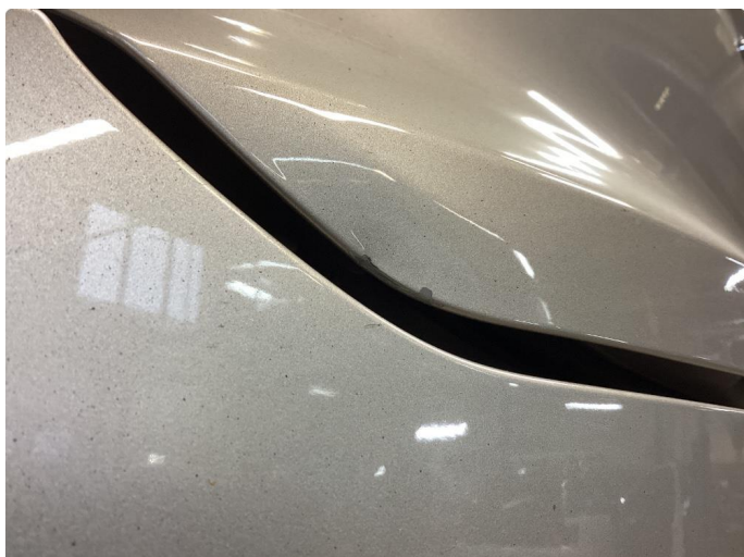
1.1 Lakk flasser