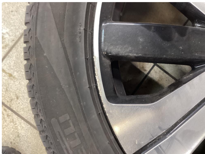
1.5 Kantkjørt felg