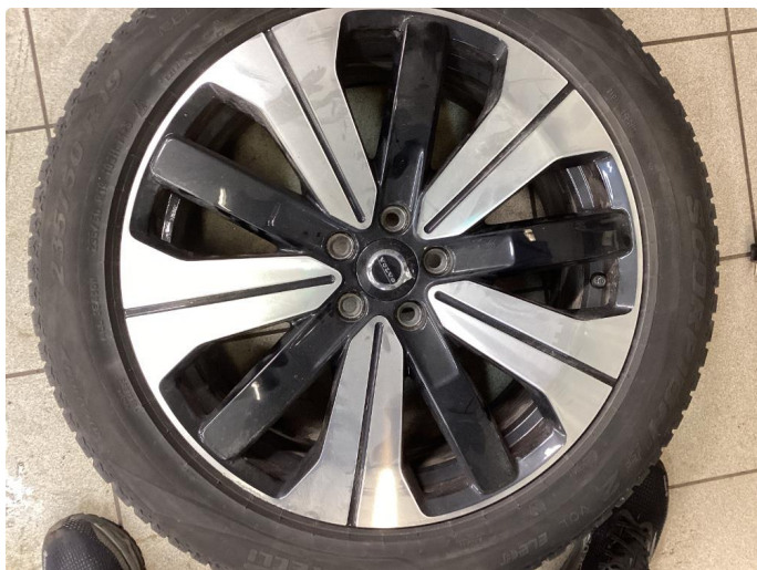
1.5 Kantkjørt felg