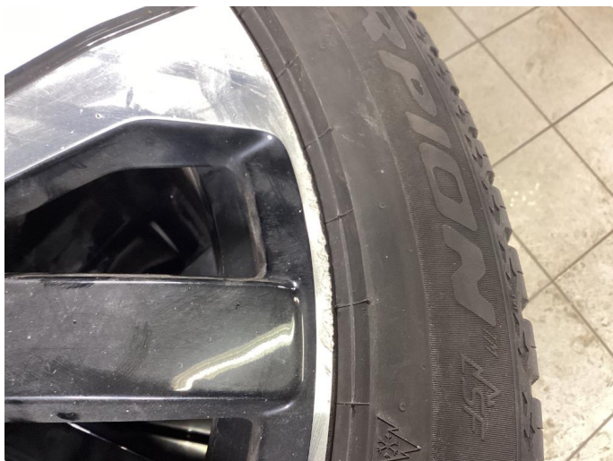
1.5 Kantkjørt felg