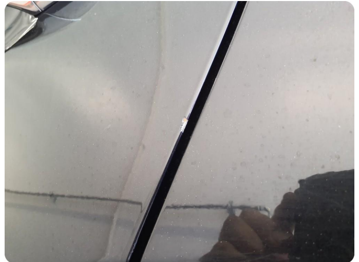
1.4 Ripe ned til grunning