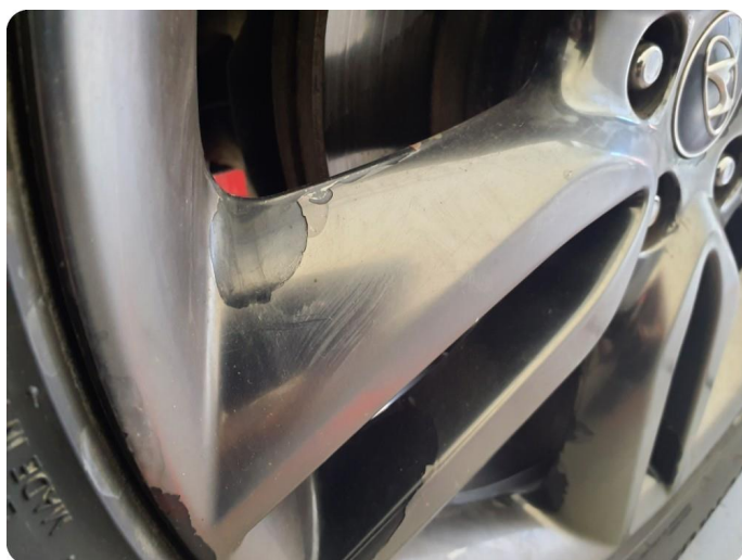
1.10 Øvrige feil Lakkslipp sommerhjul