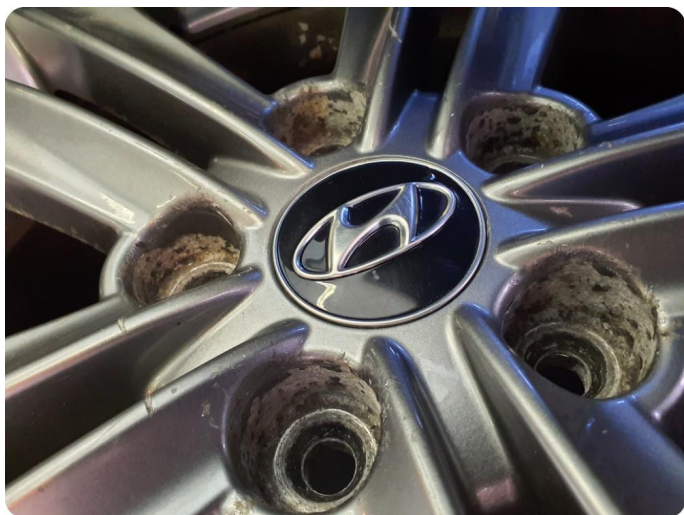
1.11 Påbegynnende oksidering Vinter