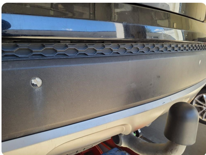
1.14 Øvrige feil Irr på sensorer bak