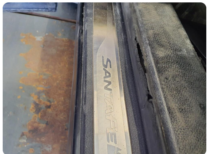
1.6 Pakning skadet