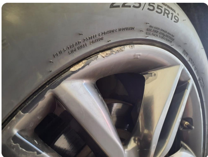
1.9 Kantkjørt felg