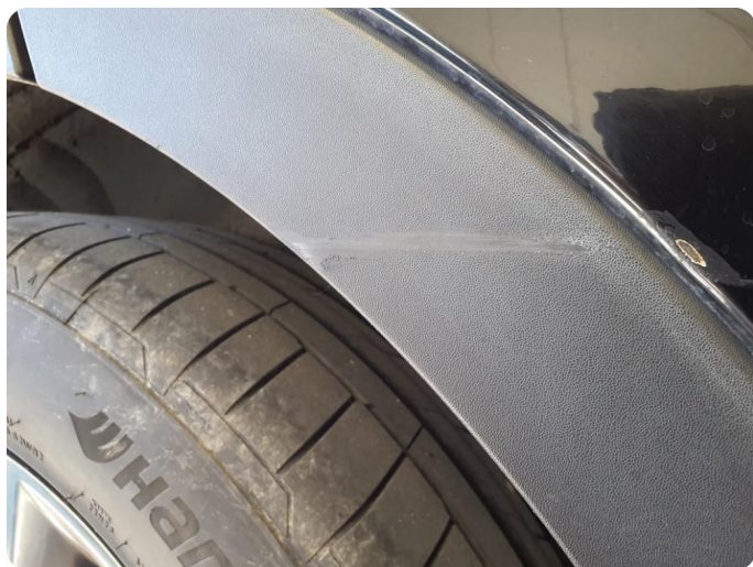
1.8 Skjermutbygger skadet