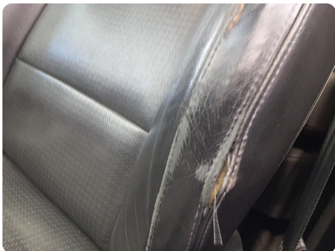
4.1 Skade på seterygg