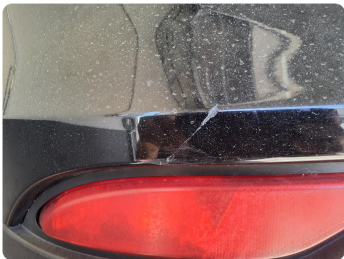
1.12 Ripe(r) ned til grunning