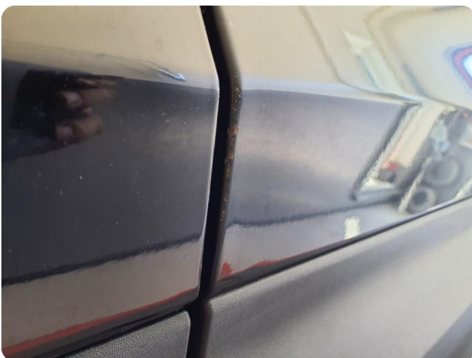
1.5 Steinsprut med rust