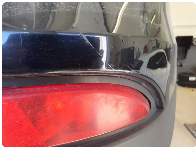
1.12 Ripe(r) ned til grunning