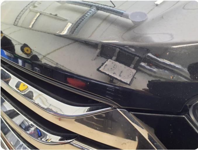
1.1 Noe steinsprut med rust