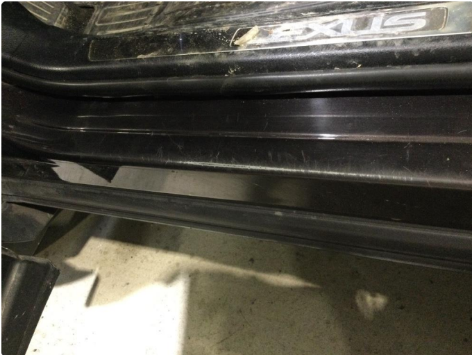
1.1 Noe slitasje i innsteg