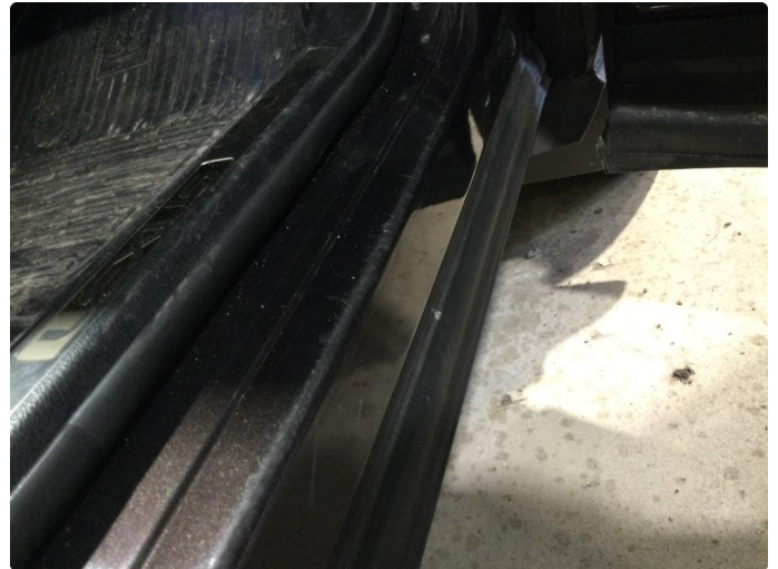
1.2 Noe slitasje i innsteg