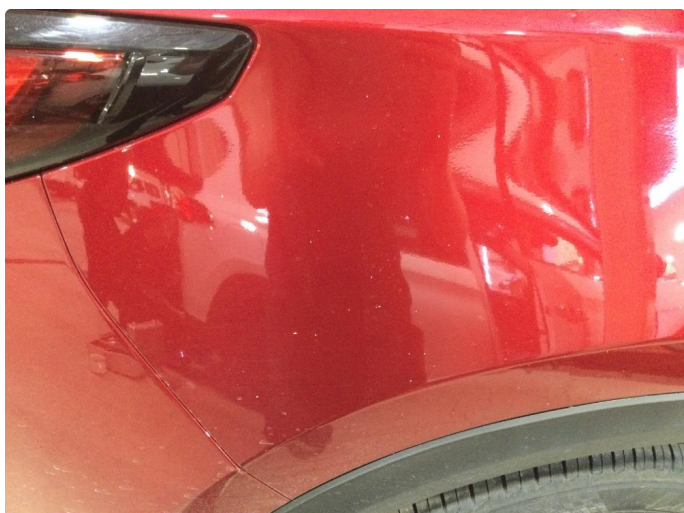
1.3 En del lakkslitasje rundt om på bilen