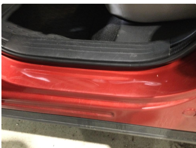
1.5 Noe slitasje i innstegene rundt om