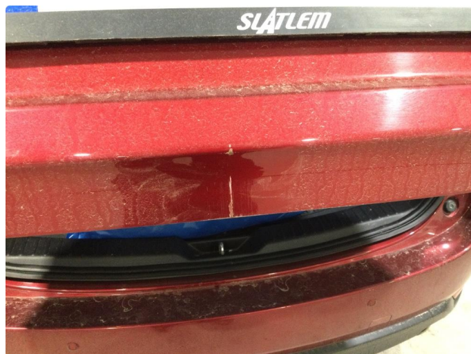
1.2 Liten lakkskade