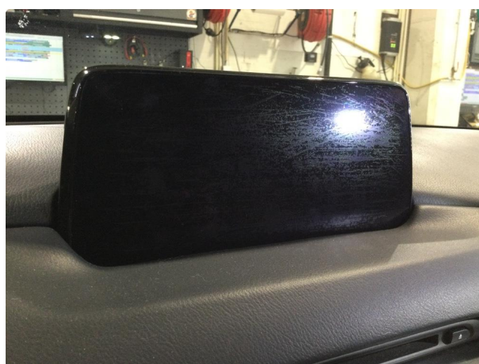
2.1 Slitasje på skjerm