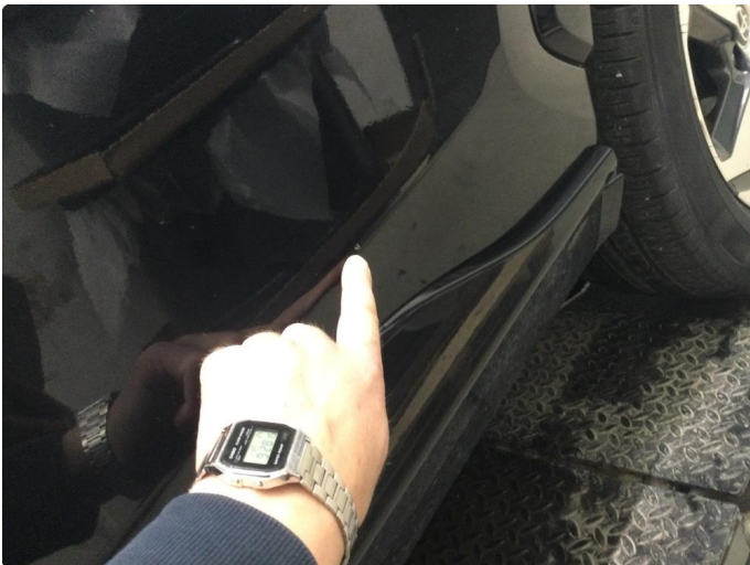
1.3 Bulk med lakkskade