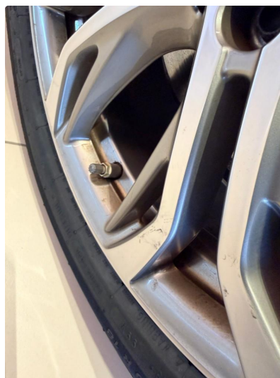
1.4 Merke i sommerfelg