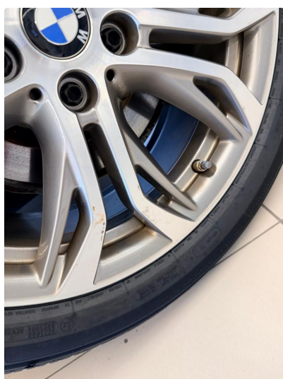
1.5 Merke i sommerfelg