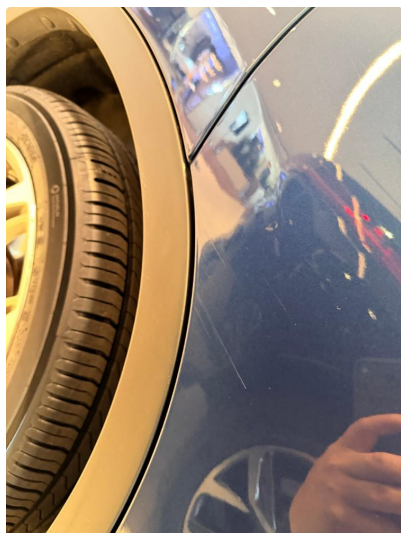
1.1 Noe riper i høyre bakdør