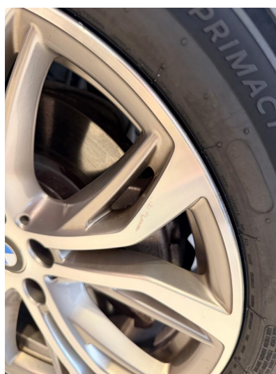
1.6 Merke i sommerfelg