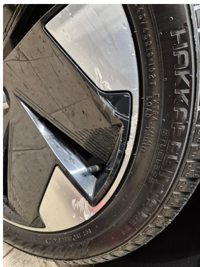
2.1 Kantkjørt felg Diamond Cut