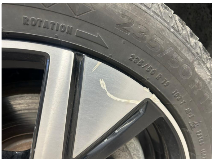
2.1 Kantkjørt felg