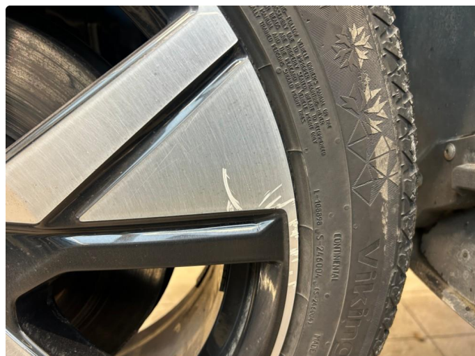
2.1 Kantkjørt felg