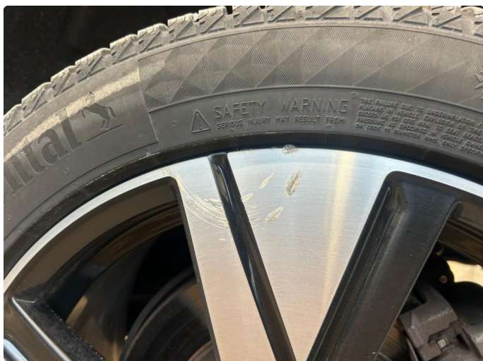
2.1 Kantkjørt felg