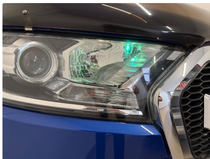
2.1 Feil farge parklys foran.