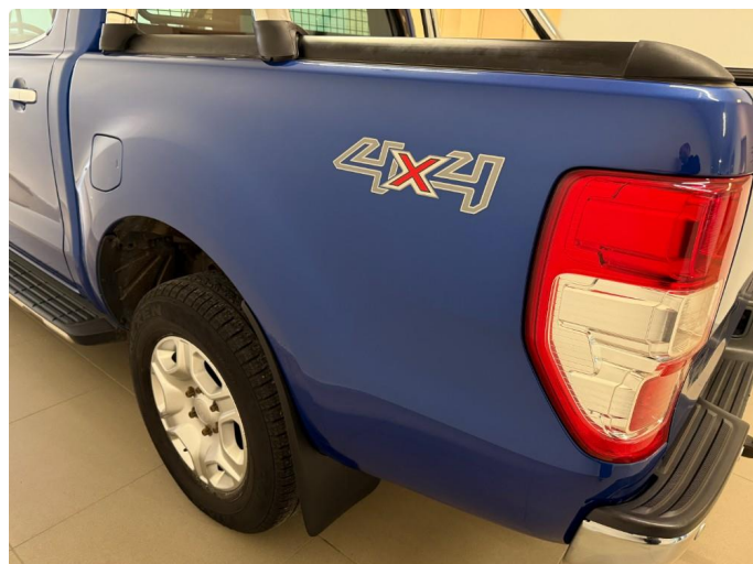
1.1 Normal slitasje iht. alder og km.stand.