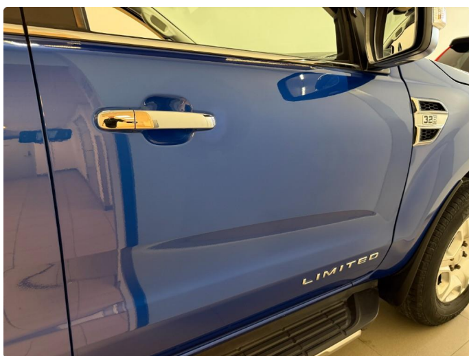
1.1 Normal slitasje iht. alder og km.stand.