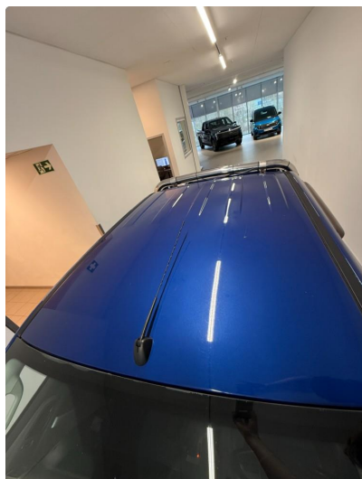
1.1 Normal slitasje iht. alder og km.stand.