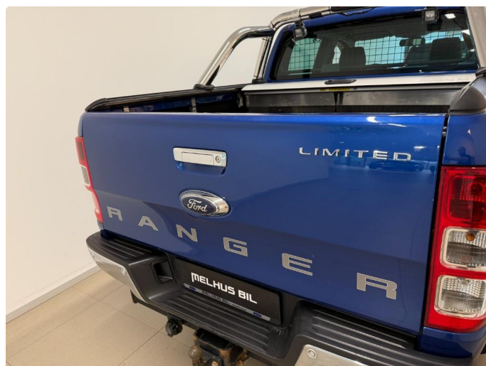
1.1 Normal slitasje iht. alder og km.stand.