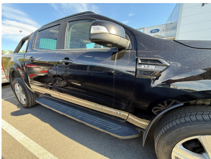
1.1 Normal bruksslitasje iht. alder og km.stand.