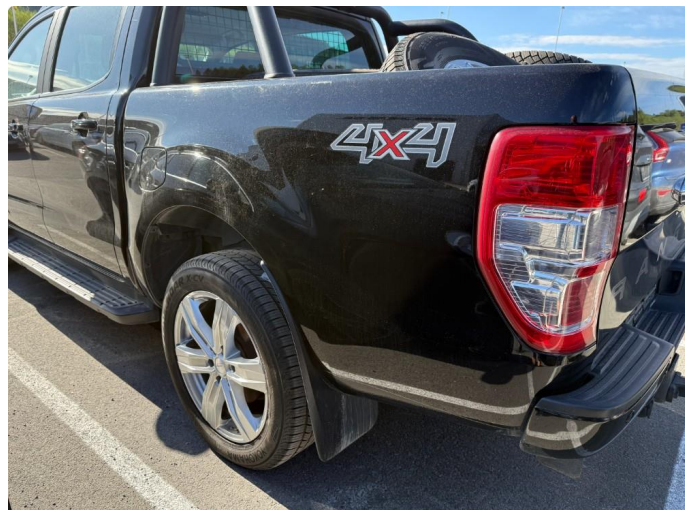
1.1 Normal bruksslitasje iht. alder og km.stand.