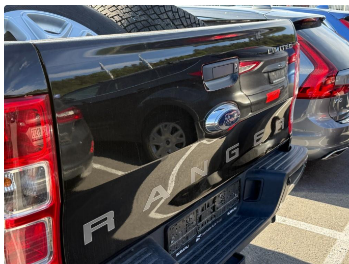
1.1 Normal bruksslitasje iht. alder og km.stand.