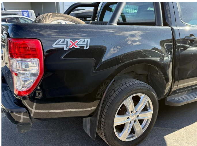
1.1 Normal bruksslitasje iht. alder og km.stand.