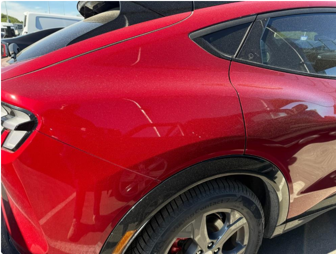
1.1 Minibulk bakskjerm høyre.