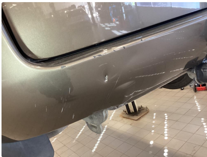
1.3 Bulk med lakkskade