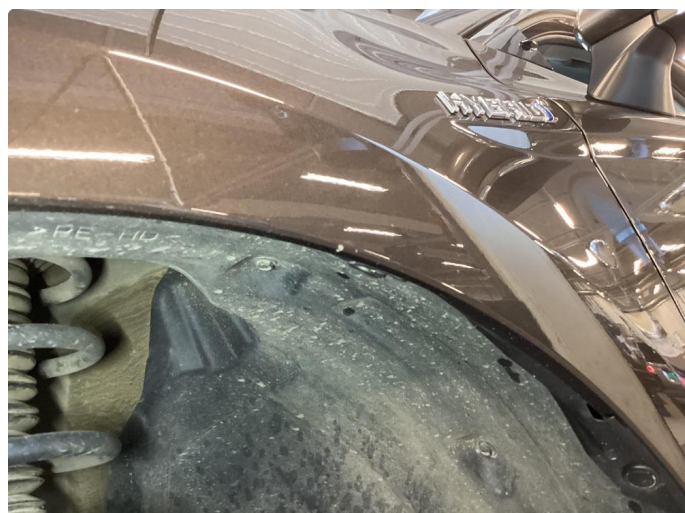
1.2 Noe steinsprut