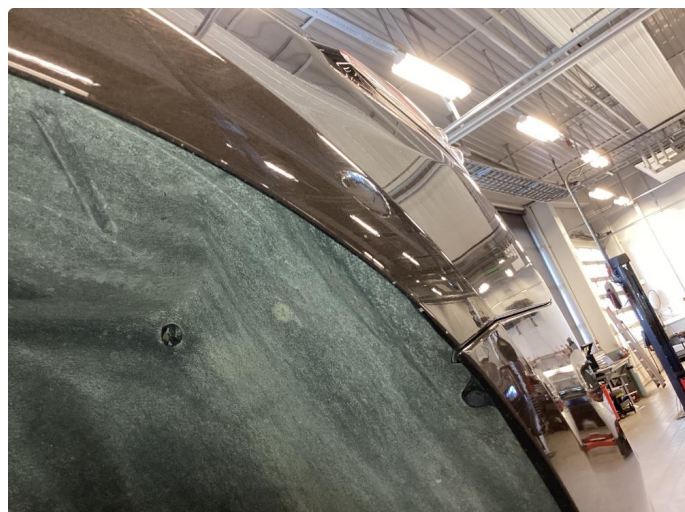
1.2 Noe steinsprut