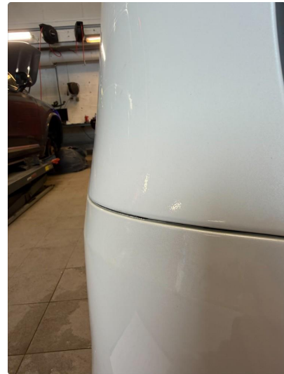
1.3 Flekket i lakkskader