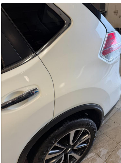
1.3 Flekket i lakkskader