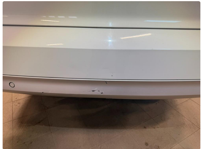
1.2 Bruksmerker rundt om, normalt ihht alder og km