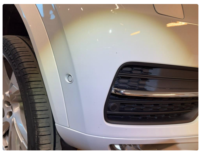
1.2 Bruksmerker rundt om, normalt ihht alder og km