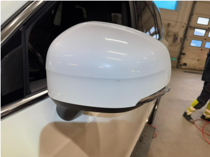
1.2 Bruksmerker rundt om, normalt ihht alder og km