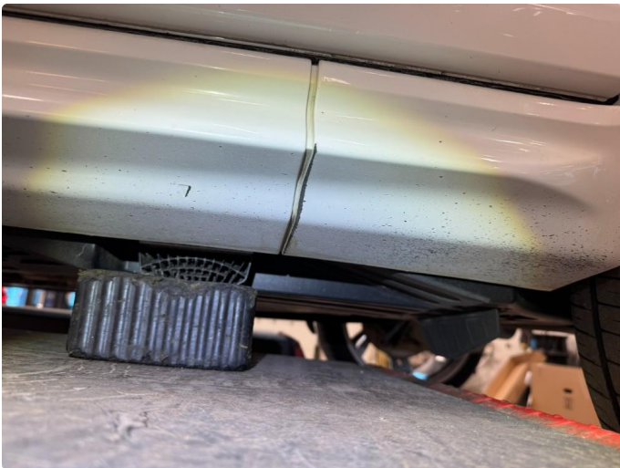
1.2 Bruksmerker rundt om, normalt ihht alder og km