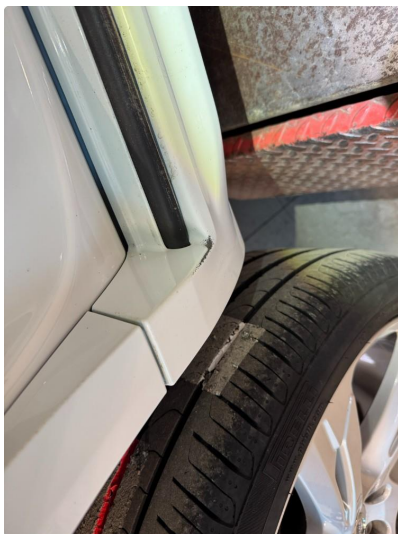
1.2 Bruksmerker rundt om, normalt ihht alder og km