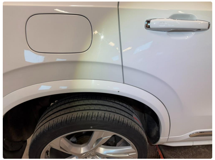
1.2 Bruksmerker rundt om, normalt ihht alder og km