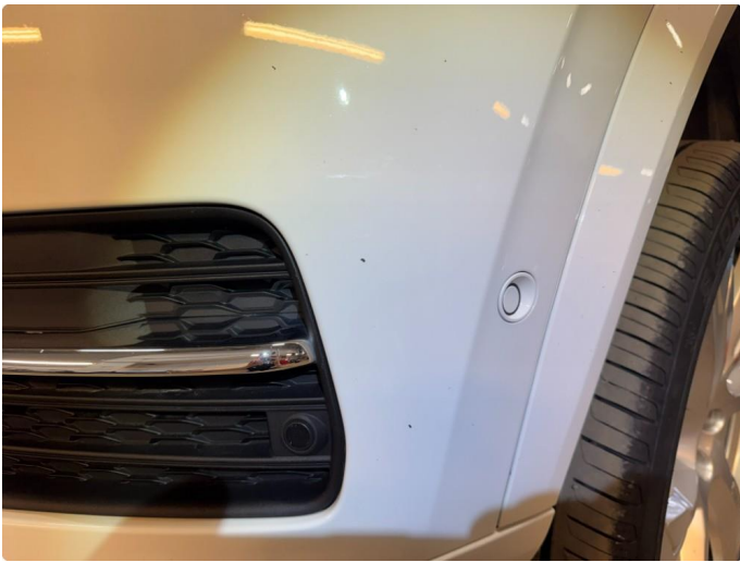
1.2 Bruksmerker rundt om, normalt ihht alder og km