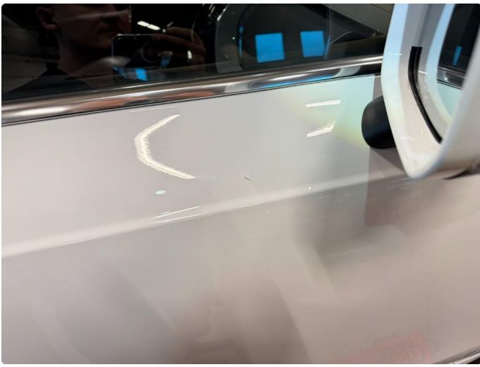
1.2 Bruksmerker rundt om, normalt ihht alder og km