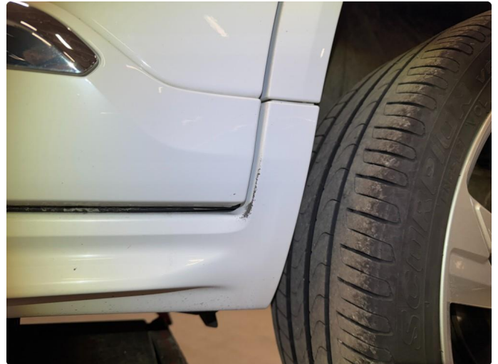
1.2 Bruksmerker rundt om, normalt ihht alder og km