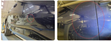
1.2 Riper inkluderer bulk