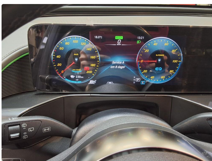
2.1 Service blir utført i juni 2026.