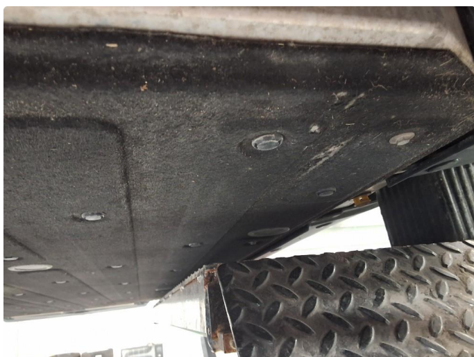
1.1 Subbeskader beskyttelsesplate under bil