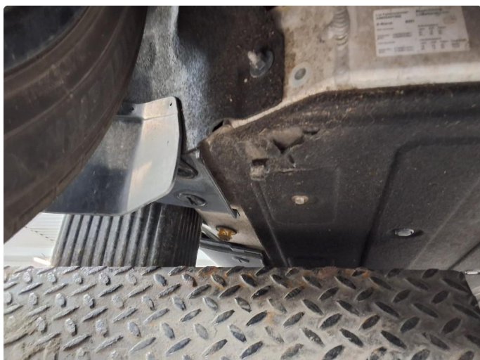
1.1 Subbeskader beskyttelsesplate under bil