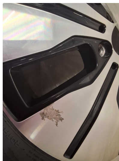
1.2 Oksidering 1 vinterfelg