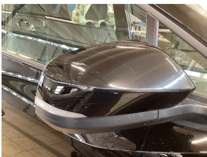
1.5 Deksel skadet/ripe