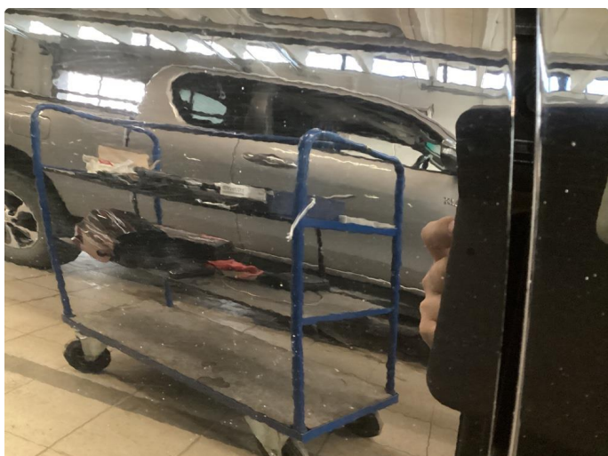
1.3 Ripe ned til grunning