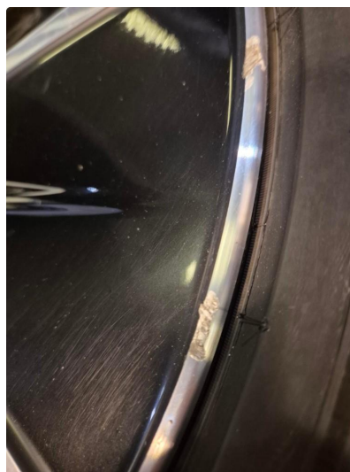
1.1 Kantkjørt felg Diamond Cut (Repareres)