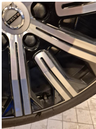
1.1 Kantkjørt felg Diamond Cut (Repareres)