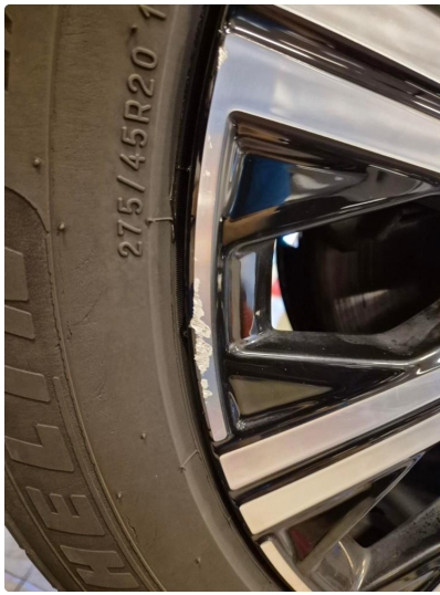
1.1 Kantkjørt felg Diamond Cut (Repareres)