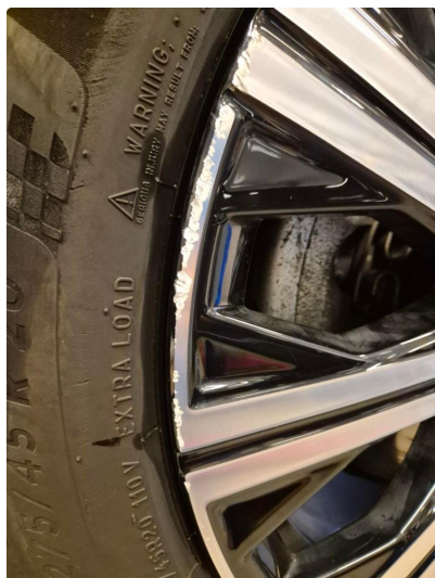
1.1 Kantkjørt felg Diamond Cut (Repareres)