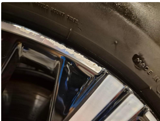
1.1 Kantkjørt felg Diamond Cut (Repareres)