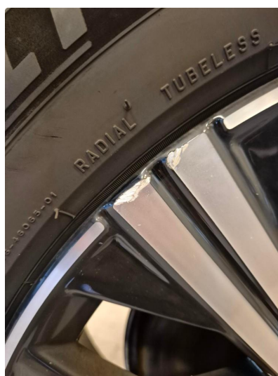
1.1 Kantkjørt felg Diamond Cut (Repareres)