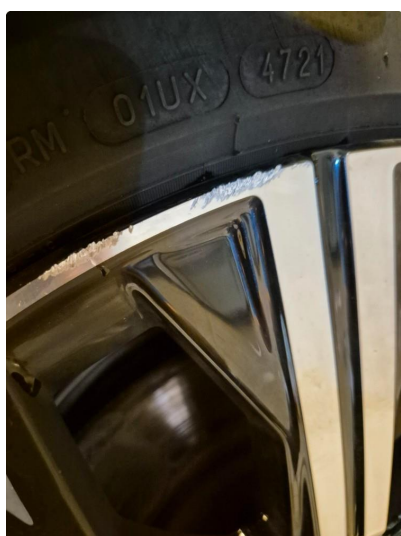
1.1 Kantkjørt felg Diamond Cut (Repareres)