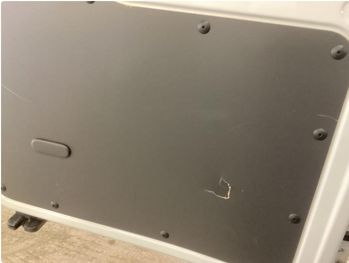
1.1 Deksler skadet/mangler