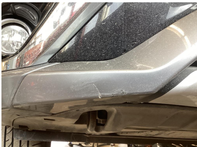
1.2 Liten skade under støtfanger foran