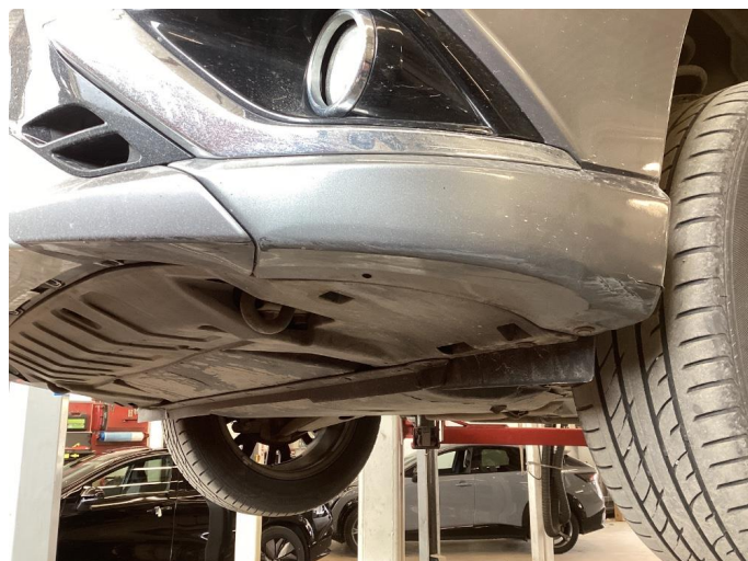
1.2 Liten skade under støtfanger foran