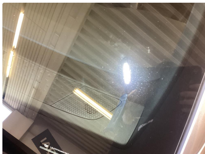
1.4 Lett steinsprut