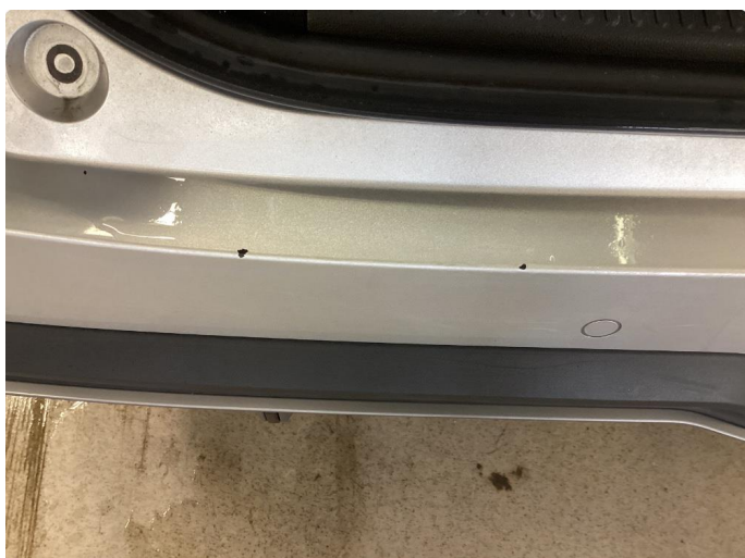
1.3 Liten ripe