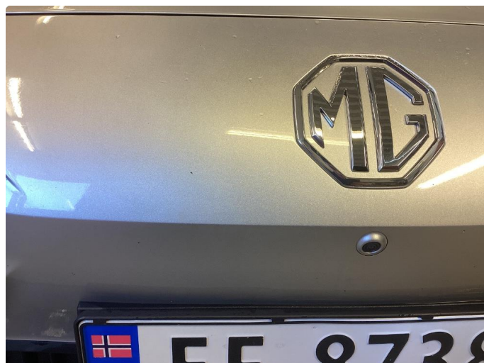
1.2 Lett steinsprut