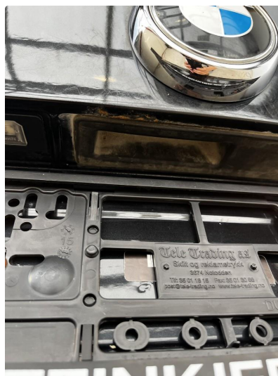
1.2 Noe korrosjon/rust