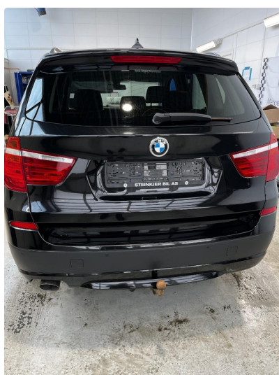
1.1 Generelt mye bruksslitasje