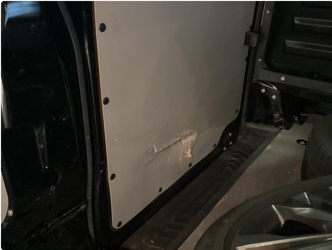
2.1 Skadet deksel i varerom