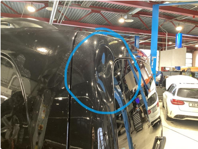
1.1 Bulk i bakluke, forsøkt utbedret