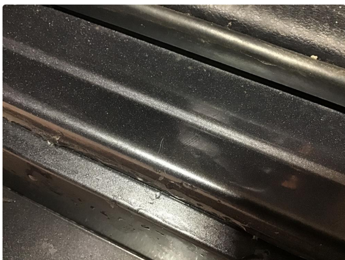
1.2 Noen riper i innsteg