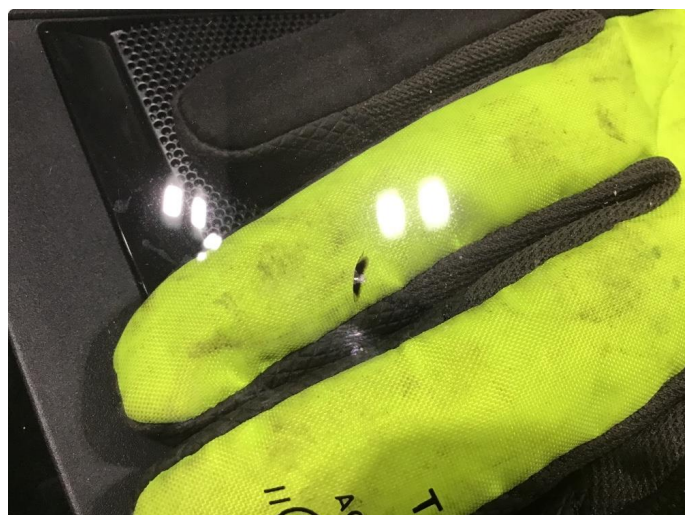
1.3 Reparert steinsprang på frontrute