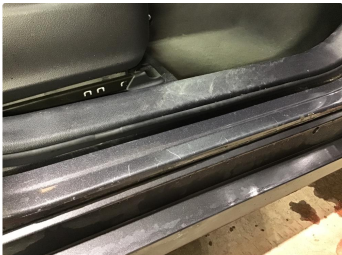
1.2 Noen riper i innsteg