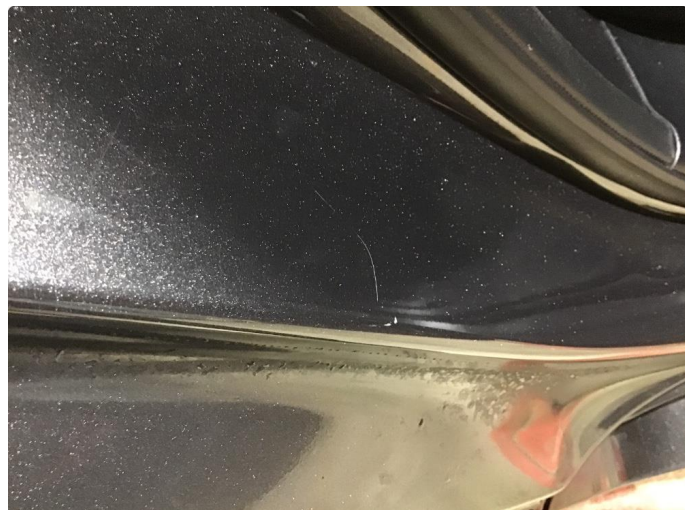
1.2 Noen riper i innsteg