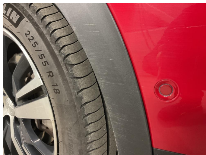
2.3 Skjermtutbygger skadet