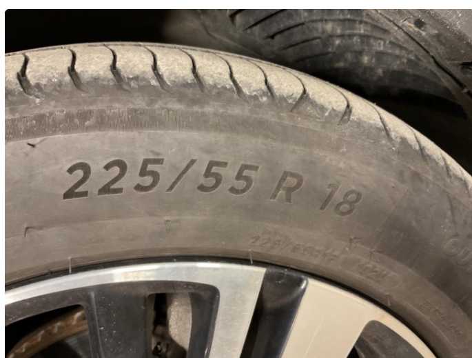
2.4 Gamle dekk