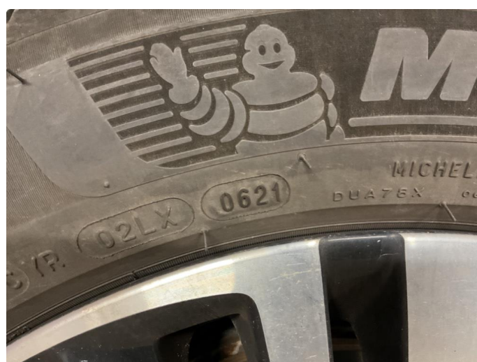
2.4 Gamle dekk